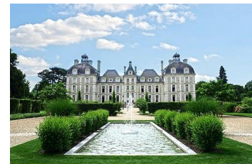
Château de Cheverny

90 m - 1034 habitants (Chevernois). Château de Cheverny, château de la Loire situé en Sologne construit au XVII e siècle.