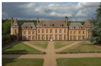
Château de la Rivière

180 m - 1433 habitants (Gonipontains). Château de la Rivière de XVII è siècle.