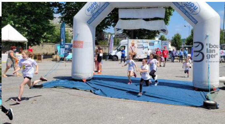
Cross des enfants